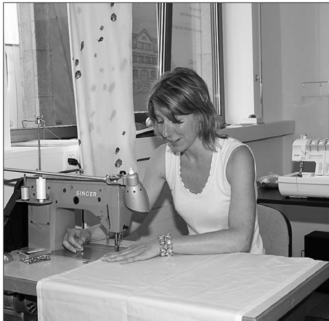
Professionelle Näharbeit gehört dazu.